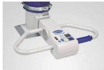
Jumbo Ergo A forgómarkolat gyors manőverezést biztosít