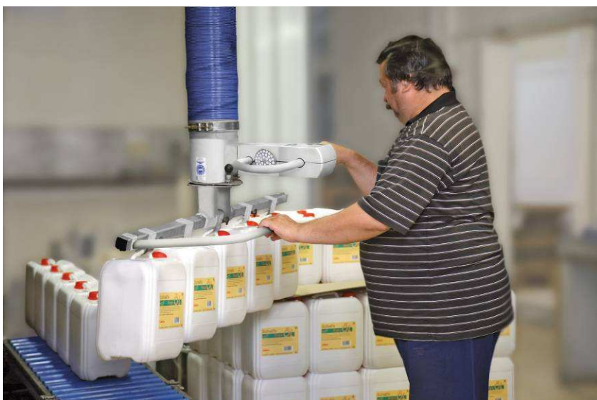
5 kanna egyszerre történő átrakása futószalagra (teherbírás 65 kg)