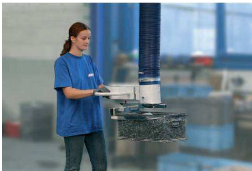
JumboErgo vákuumtömlős emelő mechanikus ládafogóval (teherbírás 65 kg)