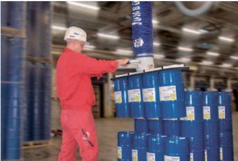
4 hordó egyszerre történő mozgatása JumboErgo vákuumtömítő emelővel (teherbírás 140 kg)