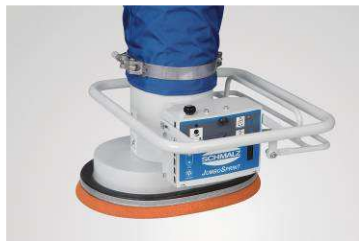
Jumbo Sprint Súlyos, nehezen megfogható terhek mozgatása