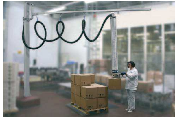
EX-kivitel: kartonok mozgatása szimpla-megfogóval felszerelt JumboSprint emelővel (teherbírás 45 kg)