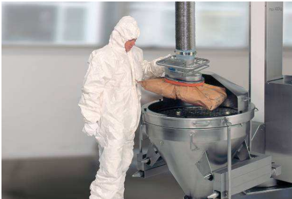
EX-kivitel: zsákok mozgatása zsák-megfogóval felszerelt JumboSprint emelővel (teherbírás 65 kg)