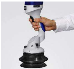
JumboFlex Egykezes működtetés