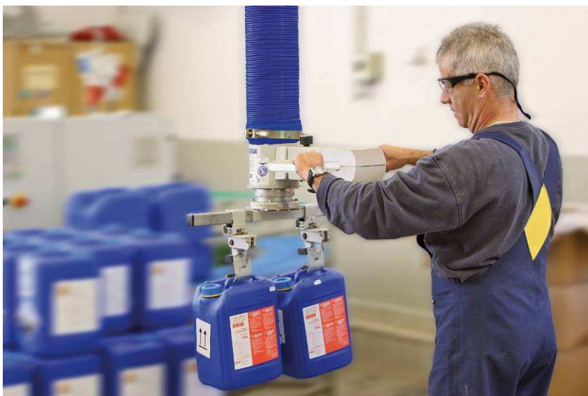
Kannák mozgatása JumboErgo vákuumtömlős emelővel (teherbírás 45 kg)