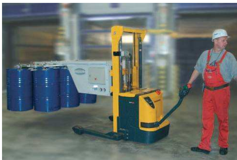
Hordók mozgatása VacuMaster vákuumos emelővel (teherbírás 140 kg)