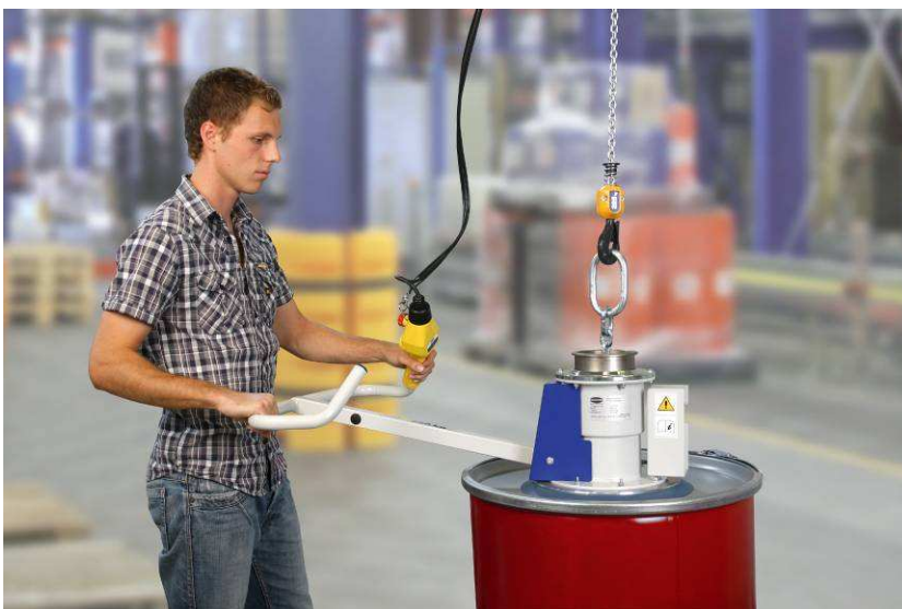
Hordómozgatás VacuMaster emelővel (teherbírás 250 kg)