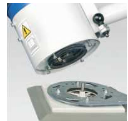
Gyorscsatlakozó SWA A megfogó egy gyorscsatlakozóval gyorsan kicserélhető