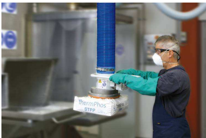
Műanyag- és papírzsákok mozgatása zsák-megfogóval felszerelt JumboSprint emelővel (teherbírás 45 kg)