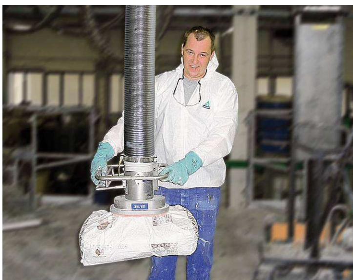
EX-kivitel Zsákok mozgatása zsák-megfogóval felszerelt JumboSprint emelővel (teherbírás 65 kg)